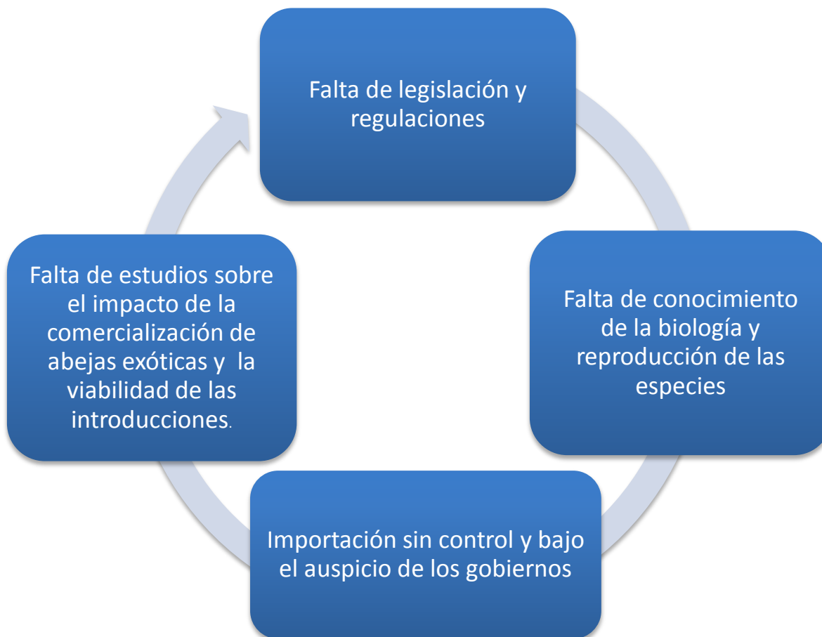
Fig. 1: Principales problemas en torno al uso comercial de polinizadores exóticos. Caso de abejorros del género Bombus .